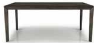
TABLE EN MERISIER MASSIF SOLID BIRCH TABLE